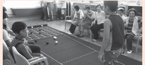
【高齢者との交流(生きがいサロン3号館)】 お年寄りの方と一緒に囲碁ゴルフとカローリングを行いました。