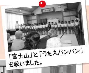
「富士山」と「うたえバンバン」を歌いました。