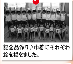
記念品作り♪巾着にそれぞれ絵を描きました。