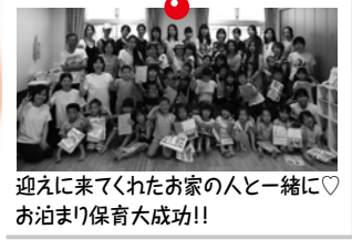
迎えに来てくれたお家の人と一緒に♡お泊まり保育大成功!!