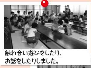
触れ合い遊びをしたり、お話をしたりしました。

7月11日(水)園の隣にある北宮西部公民館で開かれたお年寄りの方々の会食会に参加させていただきました。