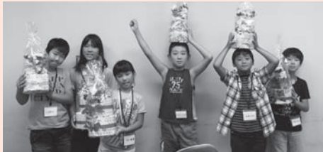
【おむつケーキづくり】 ボランティアのみなさんに教えてもらいながらおむつケーキを作りました!!

8月23日・24日に小学生ボランティアスクールを行いました。体験を通してしっかりとボランティアを学びました。参加していただいたみなさんありがとうございました。