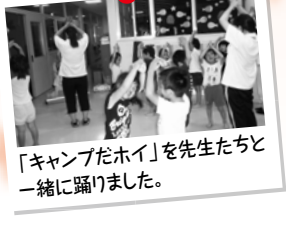
「キャンプたホイ」を先生たちと一緒に踊りました。