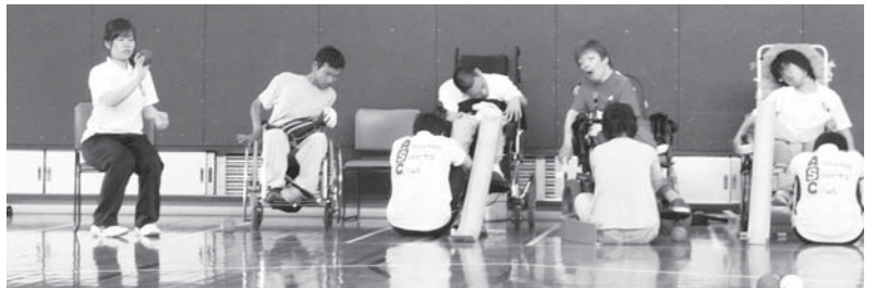
ボッチャとは…ヨーロッパで考えられたスポーツで、“ジャック”と呼ばれる白い的玉に赤・青それぞれのボールを近づける競技です。座ったまま行うので、誰でも参加できます。

ボッチャとは、子供から高齢者まで、重度障がい者から健常者まで、誰もが一緒にできるカーリングに似たスポーツです。また、パラリンピック種目でもあります。このボッチャスポーツの楽しさや面白さを知ってもらい、地域の人同士の交流を深めることをめざすとともに、スポーツを通じた具体的な障がい者・高齢者支援活動の方法について体験していただきます。とっても楽しいので気軽に、ご参加下さい。