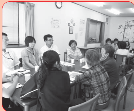
専門職も参加した「介護者のつどい」

介護する事情や立場、生活環境は様々ですが「わかりあえる仲間がいる」と、参加して良かった、また来たいと思って頂けるような取り組みを今後もすすめていきます。