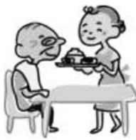
食事の準備・配膳