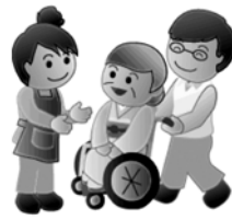
デイサービス送り出し