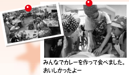
みんなでカレーを作って食べました。おいしかったよー

7月20日(金)21日(土)にお泊まり保育をしました。あいにくの雨で活動が多々変更になりました。あいにくの雨で活動が多々変更になりました。あいにくの雨で活動が多々変更になりました。あいにくの雨で活動が多々変更になりました。