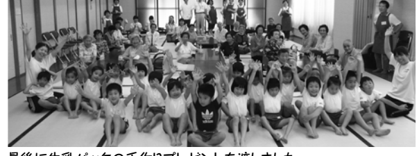
最後に牛乳パックの手作りプレゼントを渡しました。みんなで記念撮影!! 楽しい時間をありがとうございました。