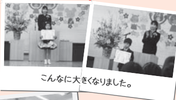
こんなに大きくなりました。