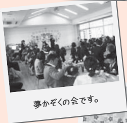
夢かぞくの会です。