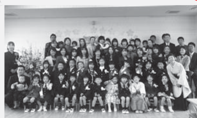
「夢かぞく」のみんな。 これから元気に頑張ってくださいね。 ずっとずっと応援しています。