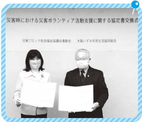
災害時における災害ボランティア活動支援に関する協定書交換式 河南ブロック社会福祉協議会連絡会 大阪いずみ市民生活協同組合