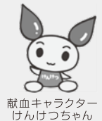
献血キャラクター けんけつちゃん