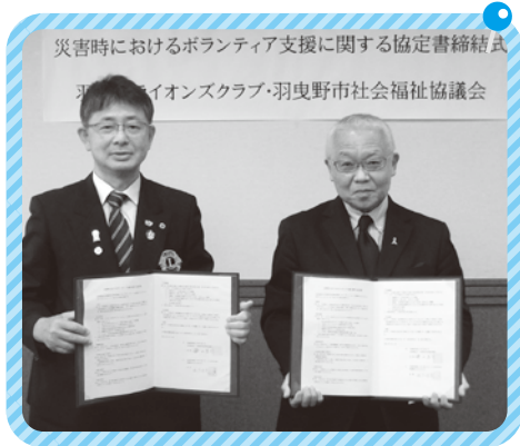
災害時におけるボランティア支援に関する協定書締結式 羽曳野ライオンズクラブ・羽曳野市社会福祉協議会