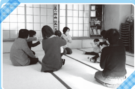
～3月に開催したときのようす～