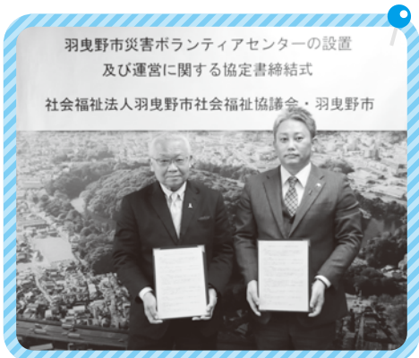
羽曳野市災害ボランティアセンターの設置及び運営に関する協定書締結式 社会福祉法人羽曳野市社会福祉協議会・羽曳野市

羽曳野市社協では、災害時の災害ボランティアセンター設置準備に向けて災害ボランティアの育成や登録をすすめる、関係機関と協働し、災害に強いまちづくりに取り組んでいきます。