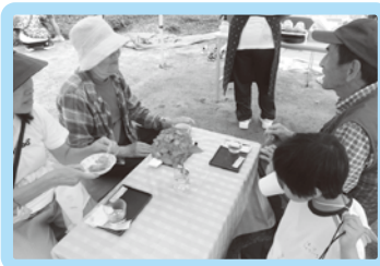
抹茶、ハーブティー わらびもちでおもてなし♪ 園児も一緒にティータイム