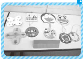
展示コーナーでは、子育てサロンで製作された作品を披露してもらいました。

本会では校区福祉委員会の活動の推進や、意見交換の場づくりを進めるために、子育てサロンの講座や見学会等を企画していきます。