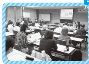
参加した親子が楽しく過ごせるよう参加者どうしで情報交換していました。