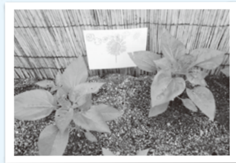
はっぴ何枚あるかなあ～？