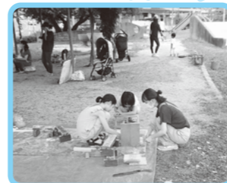
公園で安全に子どもたちと遊ぶボランティア