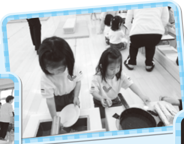
洗い物にお料理大忙し♪