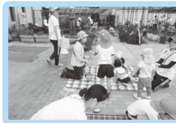
お手玉やけん玉 オセロ、こま回しなど。