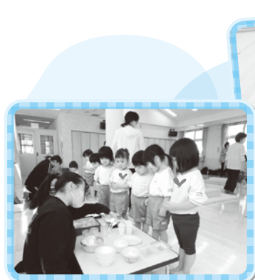
何、つくろっかなあ～