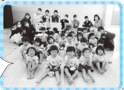
みんなてながよくハイ、チーズ！