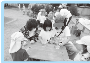
フラワーガーデンで 好きなお花や葉っぱを摘み、 世界に一つだけのしおり作り。