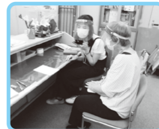
電話傾聴ボランティア(お話し相手)