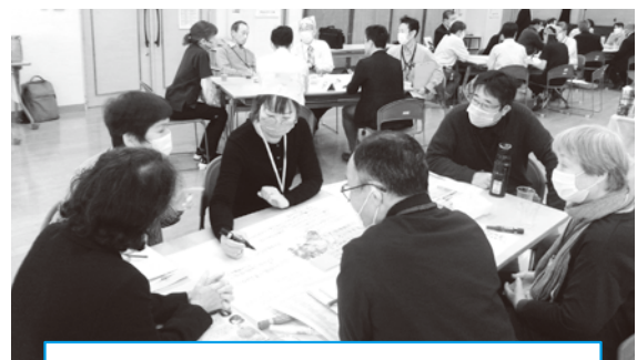
11月2日 石川プラザ(東エリア)