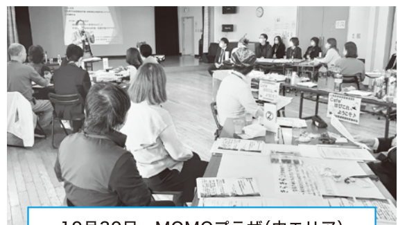
10月30日 MOMOプラザ(中エリア)