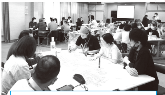
10月26日 北宮中部公民館(西エリア)