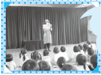
コープ 「えほんで スマイルキャラバン隊」 えほんの読み語り、 ゲームなど みんな楽しんでよ