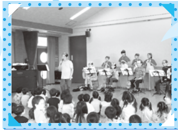
ボランティア グループ 「玉手箱」 ギター・ピアノ・ アコーディオン・ ハーモニカの 楽器演奏に 歌で参加したよ